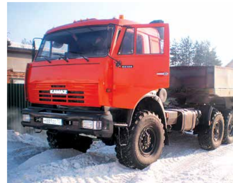
→ Посёлок Тимирязевский, стоянка техники ООО «СК «Универсал»