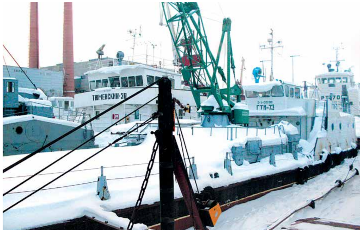
→ Посёлок Самусь, отстой флота ООО «СК «Универсал»