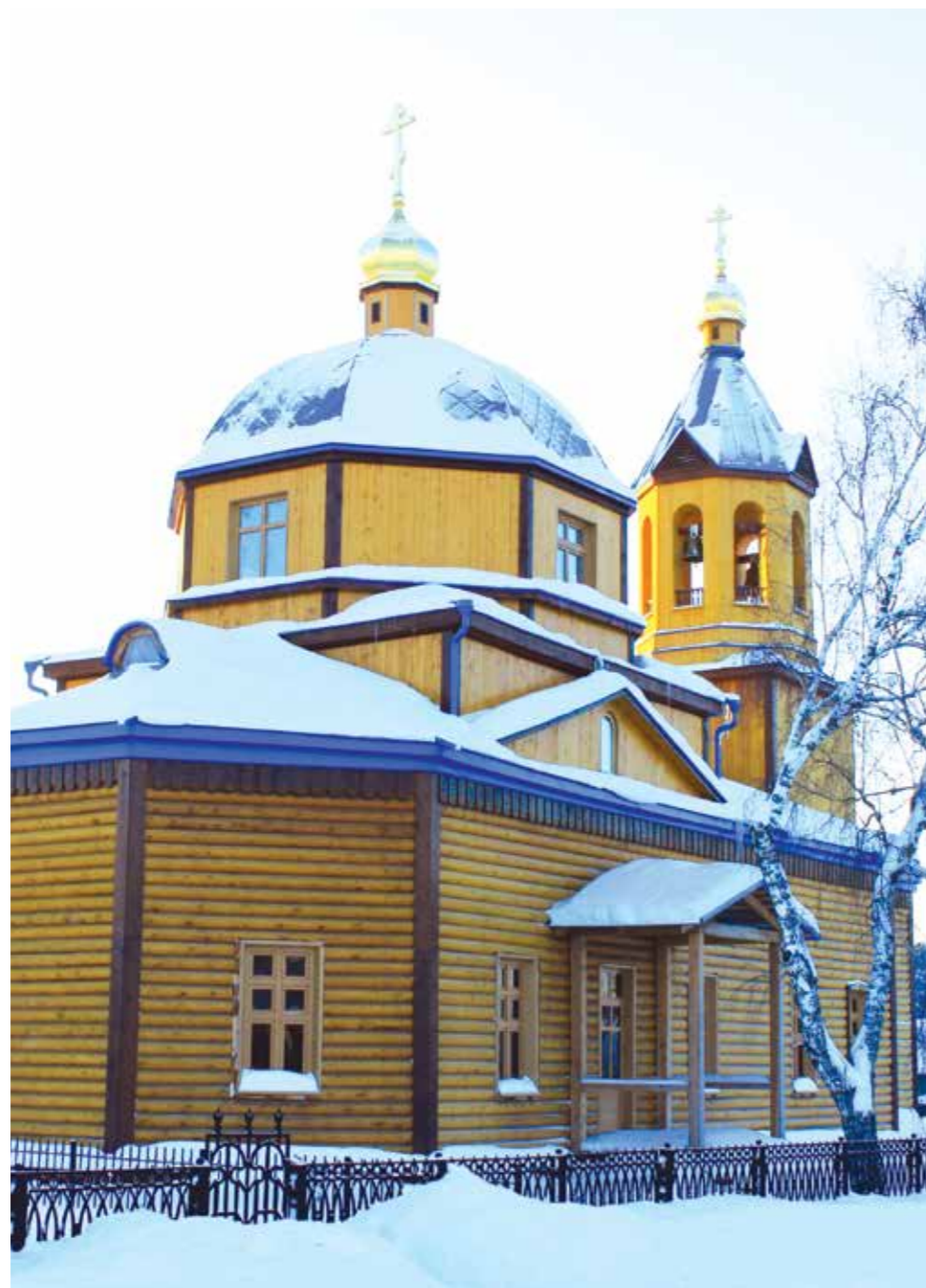
→ Село Зоркальцево, церковь Иконы Божьей Матери Одигитрия, реставрация, 2004-2009 годы