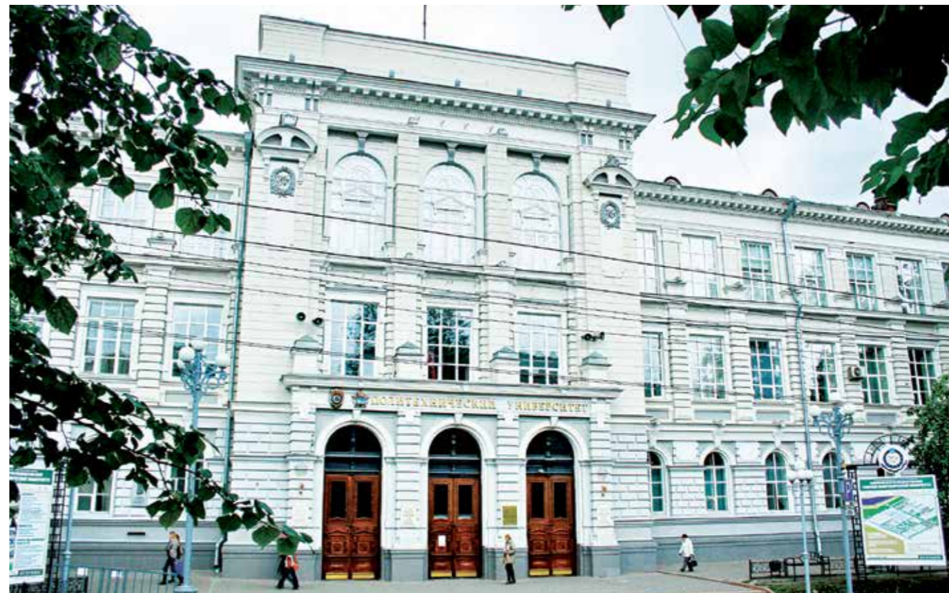
→ Город Томск, главный корпус ТПУ, реставрация и благоустройство, 2002-2010 годы

Наружные работы тоже подразумевают очистку, обеспыливание, обезжиривание, кроме того, нанесение одного слоя грунта с дальнейшей покраской. Хочу отметить, что это — высокотехнологичный труд, требующий самого пристального внимания не только с точки зрения качества, но и с позиции безопасности труда, охраны здоровья сотрудников. Мы гордимся тем, что можем выполнять данные виды работ быстро, качественно и в полном соответствии с современными экологическими нормативами.