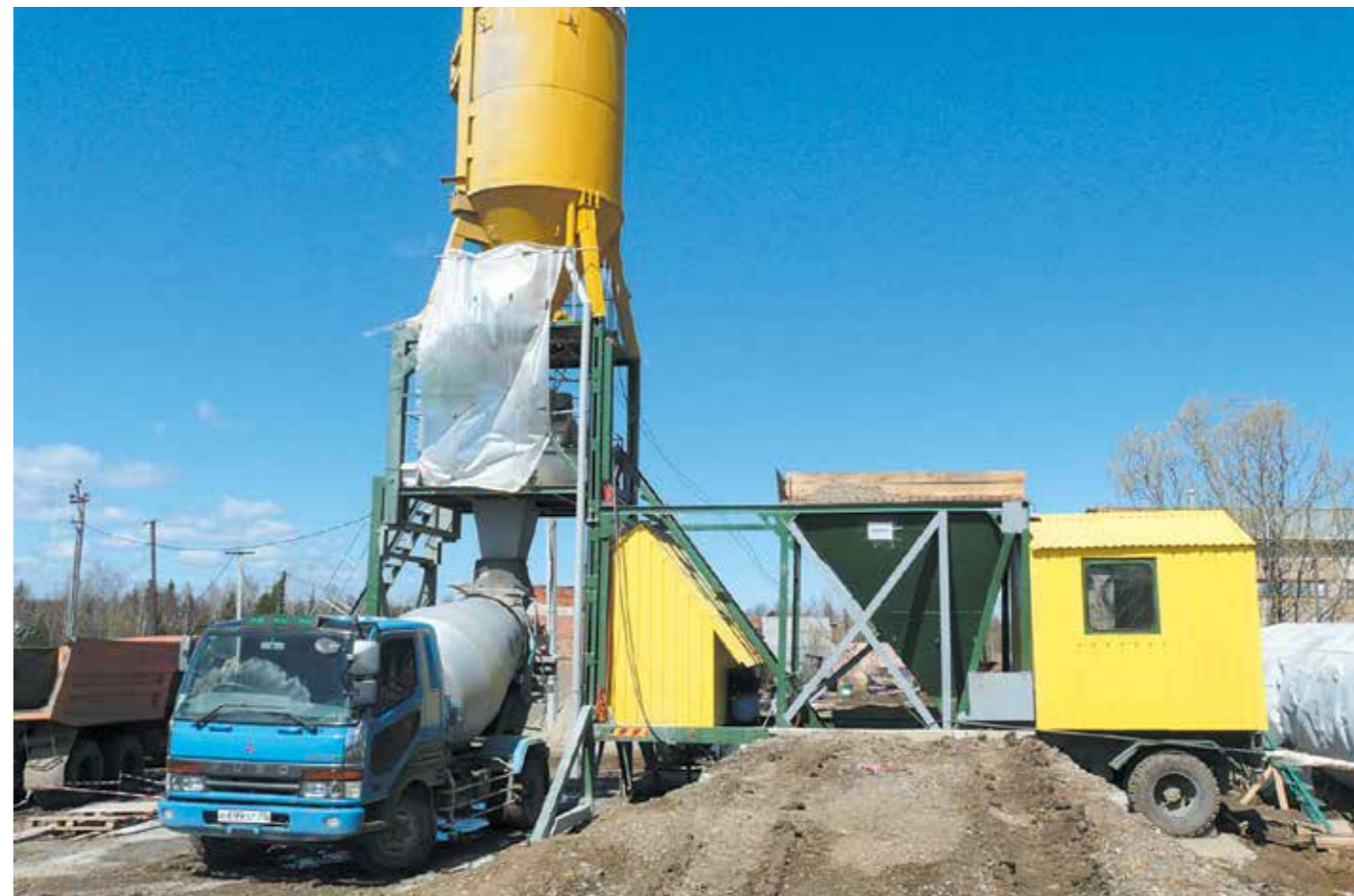
→ Село Парабель, растворо-бетонный узел ООО «СК «Универсал»

Однако ключевым достоинством нашей компании я считаю стабильность работы: у нас практически нет сезонности. Мы шли к этому годы — подбирали персонал, приобретали оборудование, осваивали новые виды работ. ООО «СК «Универсал» — одна из немногих организаций в Томске, кто имеет допуск к строительству особо опасных объектов. Мы подстраиваемся к требованиям рынка, осваивая те виды работ, которые являются наиболее востребованными в настоящее время. И в результате сегодня можем гордиться производственной и финансовой стабильностью.