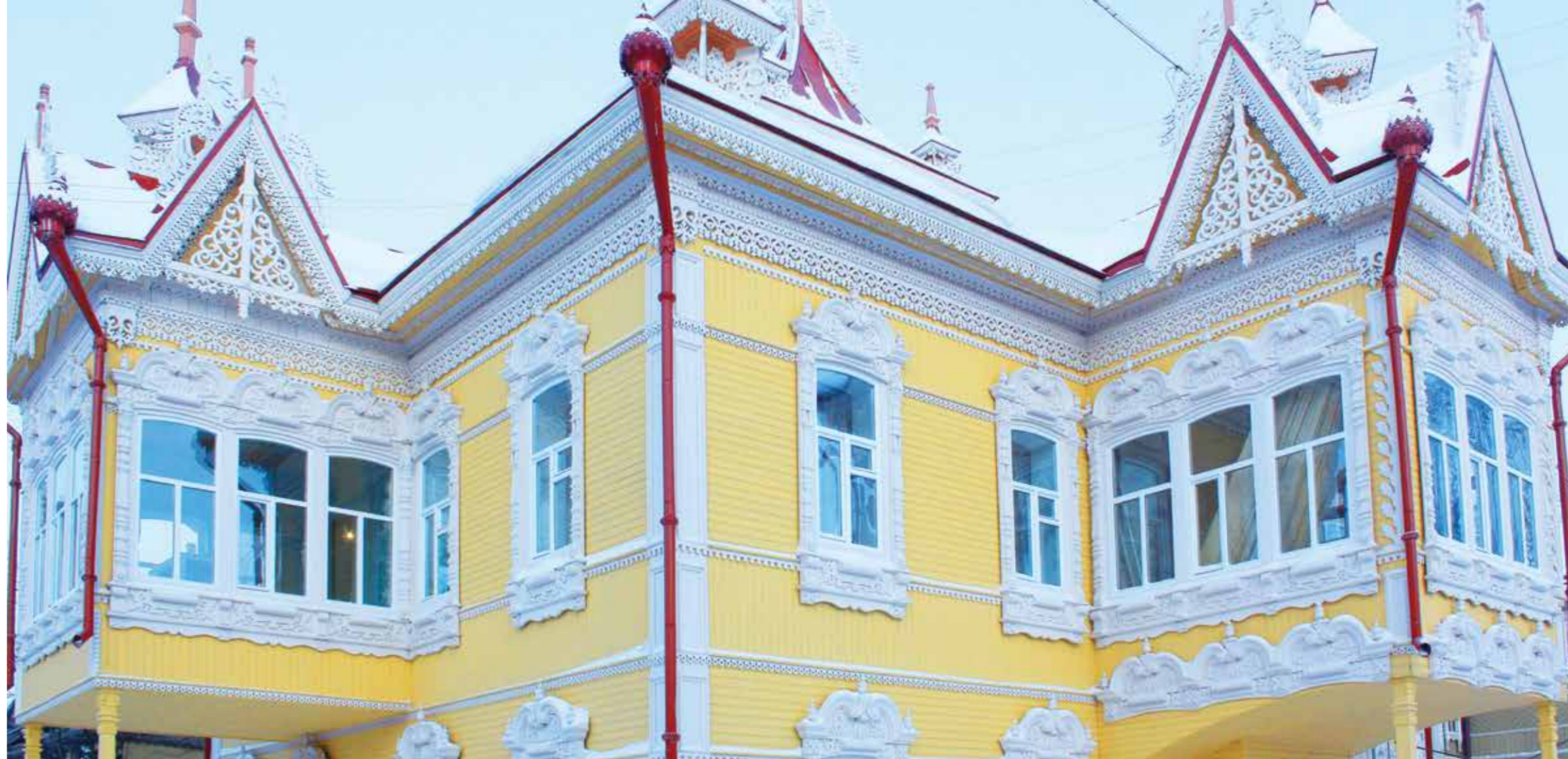
→ Город Томск, ул. Красноармейская, 67а, реконструкция, 2009-2010 годы