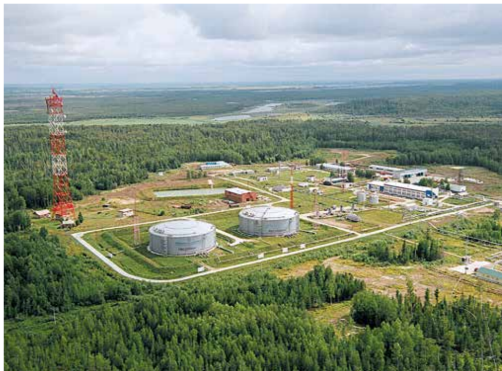
→ Томская область, Александровский район, НПС «Раскино», капитальный ремонт объектов станции, 2000-2010 годы