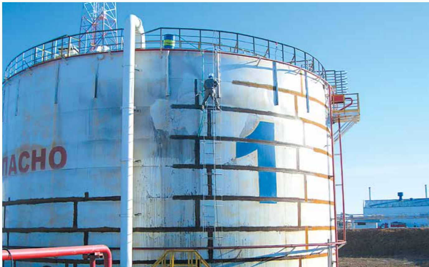
→ Иркутская область, город Ангарск, Ангарский узел налива нефти, выполнение антикоррозионных работ, 2008 год