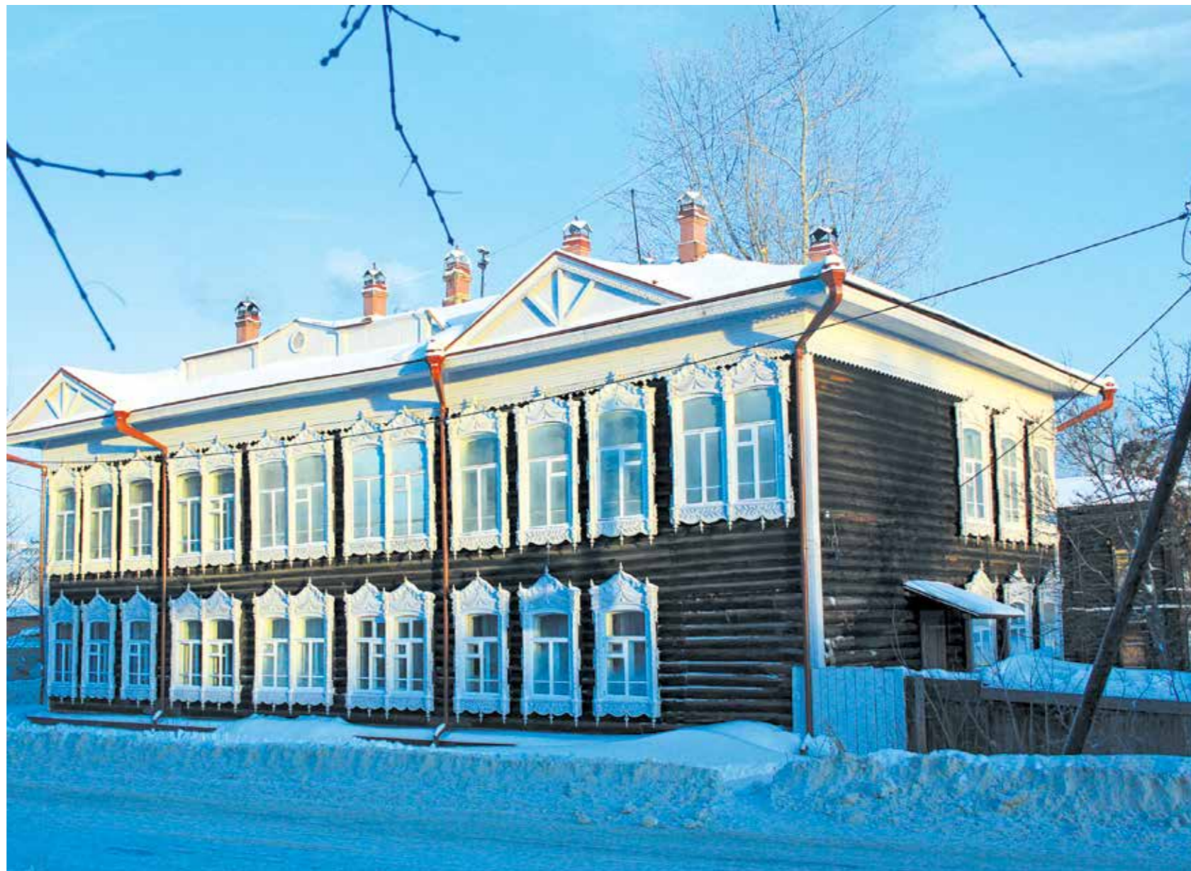
→ Город Томск, ул. Шишкова, 1, реконструкция, 2009 год

Учредитель строительной компании ООО «СК «Универсал», учредитель строительной компании ООО «Сибстройинвест». Окончил факультет прикладной математики и кибернетики Томского государственного университета. Первыми навыками строителя получил ещё в студенческие годы в стройотрядах. Тогда же понял, что настоящее его призвание – созидать. В строительной отрасли с 1988 года. С 1989-го по 1996-й руководил кооперативом «Факел», занимавшимся строительством и ремонтом объектов теплоэнергетики (котельных, теплотрасс).