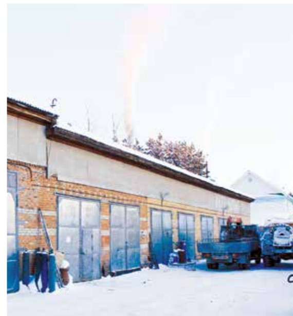
→ Посёлок Тимирязевский, производственная база ООО «СК «Универсал»

со всей России и за рубежом. Основной акцент стараемся делать на отечественных производителях, причём география закупок ООО «СК «Универсал» весьма широка — от Санкт-Петербурга и Москвы до Иркутской области. Далее, в задачу нашего отдела входит логистический расчёт и доставка материалов до места проведения работ.