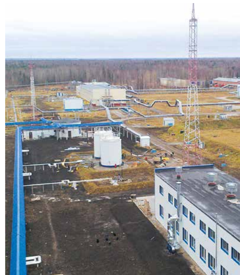
→ Село Парабель, строительство очистных сооружений НПС «Парабель», 2009 год

Не менее важна, как мне кажется, наша работа по сохранению памятников деревянной архитектуры Томска. Компанией ООО «СК «Универсал» на объектах деревянного зодчества производятся работы по капитальному ремонту и реконструкции домов (замена оконных и дверных блоков, венцов, кровли, всех инженерных коммуникаций, усиление фундаментов).